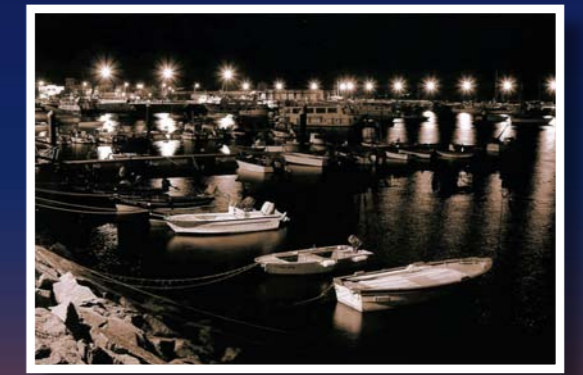
Concurso de Fotografía "turismogrove.com" 2008: 2º premio