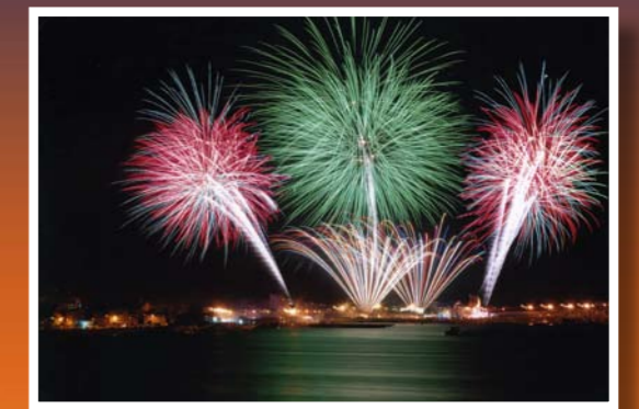
Concurso de Fotografía "turismogrove.com" 2008: 3º premio